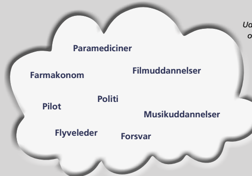
Uddannelser uden for det ordinære uddannelsessystem. Det vil sige uddannelser, som ikke har et trin i kvalifikationsrammen.

I højre side studerer man deltid. Der er skoleperioder og perioder, hvor man arbejder og er i praktik. Oftest får man løn under hele uddannelsen, når man uddanner sig i den højre side af figur 2.